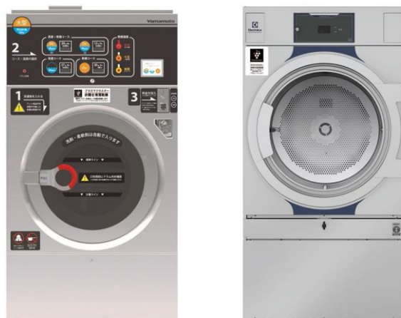
プラズマクラスターイオン発生ユニットを搭載した業務用洗濯乾燥機（左）と業務用乾燥機（右）

家庭内の衣類や寝具に、清潔品質をプラス！ プラズマクラスターイオン発生ユニットを搭載した業務用乾燥機、業務用洗濯乾燥機を エレクトロラックス・プロフェッショナル・ジャパンと山本製作所が、コインランドリー市場向けに発売 ～業務用 乾燥機・洗濯乾燥機で初、除菌と静電気抑制効果を実証～